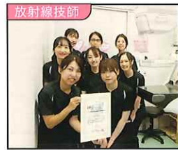
私たちが担当しています