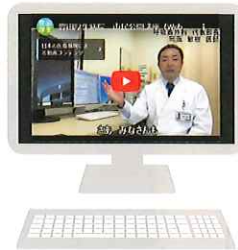
早期発見が大切 「特定健診・がん検診」を受けよう