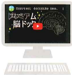
認知症予防 「プレミアム脳ドック」を受けませんか