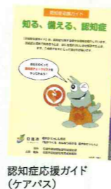
認知症応援ガイド(ケアパス)